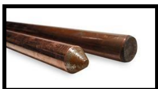
Figura 3: Hastes de cobre de 5/8" x 2,4m, (alta camada).