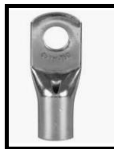
Figura 7: Terminal à compressão para cabos de 50/70mm².