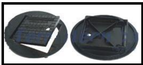
Figura 11: Tampa Reforçada com Escotilha em Ferro Fundido.