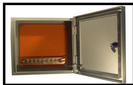
Figura 14: Caixa de Equipotencialização com 9 Terminais.