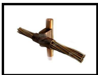
Figura 4: Solda Exotérmica Haste x Cabo.