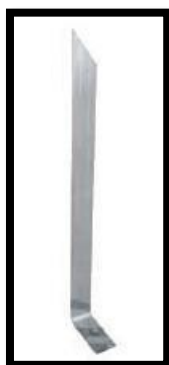
Figura 2: Terminal Aéreo tipo barra chata 300mm.