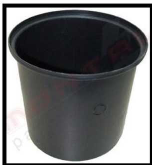
Figura 10: Caixa de Inspeção Tipo Solo em Polipropileno Preta.