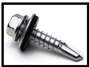
Figura 9: Parafuso Autoperfurante Sextavado.