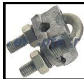
Figura 5: Conector cabo-haste em bronze estanhado.