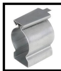
Figura 6: Abraçadeira Aço Galv. Tipo "D".