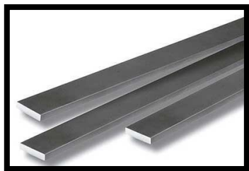
Figura 1: Barra chata em alumínio 7/8" x 1/8" –70mm².