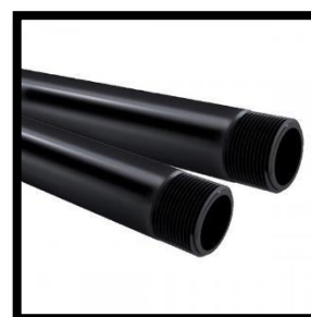
Figura 8: Eletroduto PVC Ø 1" Barra 3m