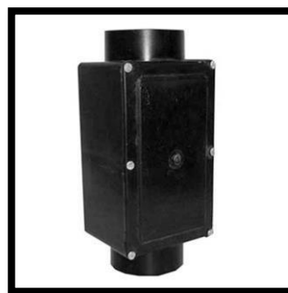
Figura 12: Caixa de Inspeção Polipropileno Suspensa 1. 1/2" .